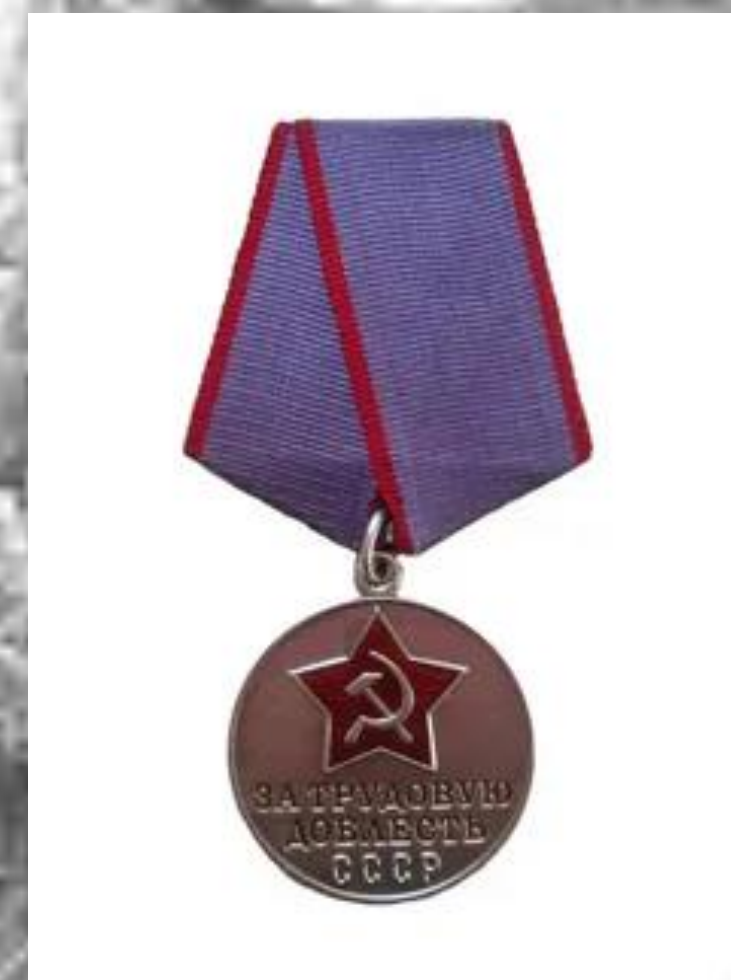
Медаль «За трудовую доблесть» (обр.)

Вручен за значительное перевыполнение плановых заданий в ходе соцсоревнования к 40-летию революции 1917 г.